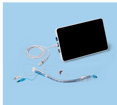
Ambu® VivaSight™ 2 DLT connesso al monitor Ambu® aView™ 2 Advance.