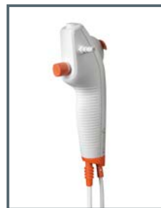
L'impugnatura ergonomica e leggera è progettata per fornire una presa salda e comoda