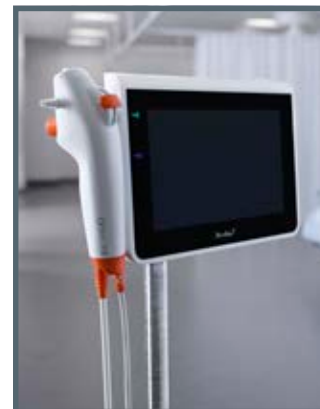
Ambu® aScope™ 4 Broncho Large e Ambu® aView™