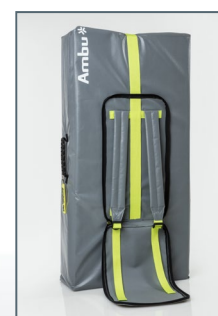
Borsa per il trasporto (materassino incluso)