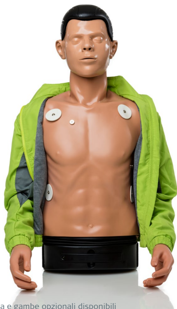
Braccia e gambe opzionali disponibili