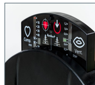
Display di monitoraggio