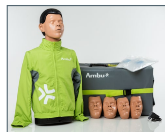
AmbuMan Defib Torso