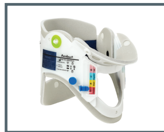
Ambu® Perfit ACE®